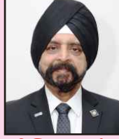
डिस्ट्रिक्ट गव्हर्नर रो. राजिंदरसिंग खुराना